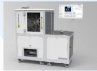
CFP800 型卷烟燃烧锥落头倾向测试仪